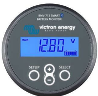
Bluetooth-Erkennung BMV-712 Smart Battery Monitor